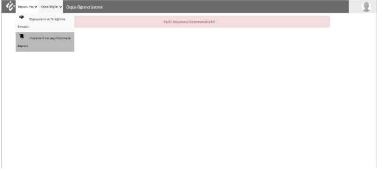
Şekil 8- Diploma ile Başvuru Ekranı

“Diploma Bilgileri” menüsünde “Uluslararası Sınav veya Diploma ile Başvuru” türü seçilerek istenen sınav-puan bilgileri ve “Uluslararası Geçerliliği Olan Sınav Belgesi/Diploma Yükleme” alanından gerekli belge yüklenerek “Bilgileri Kaydet” butonuna tıklanarak başvuru işlemleri tamamlanır.