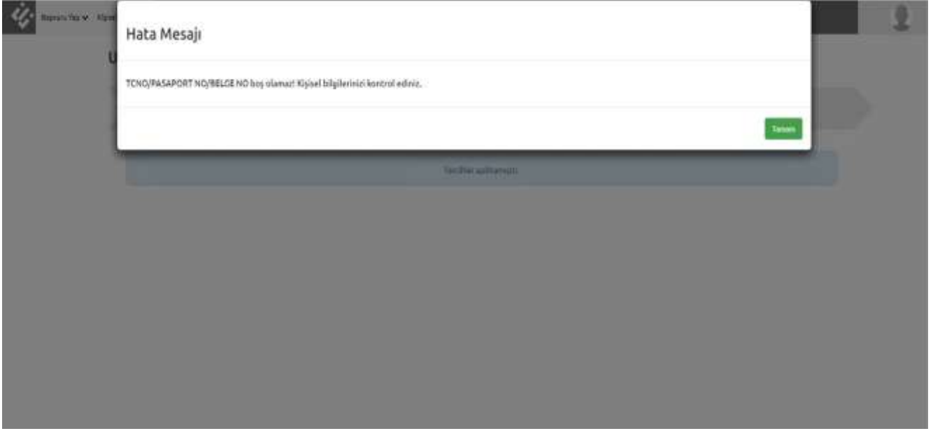
Şekil 5- Form Eksik Hatası